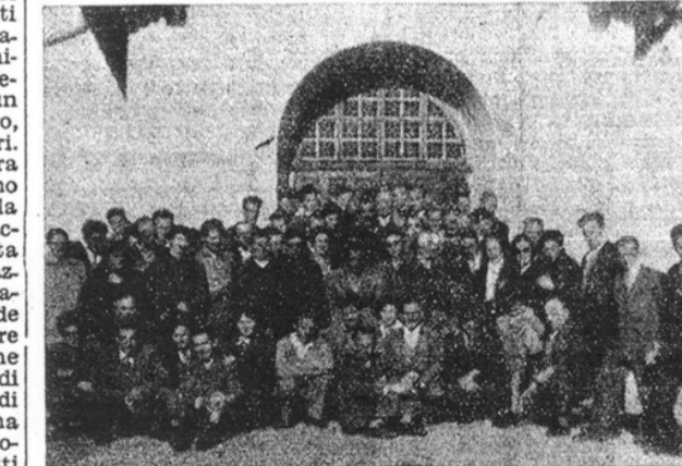
A Davos (Svizzera) un gruppo di abitanti di Piazza Brembana si è incontrato, recentemente, con emigrati bergamaschi. Chi lavora all'estero prova una grande gioia nel vedere i propri concittadini e nel trattenerli con essi a parlare del paese lontano, ricordato sempre con nostalgia.